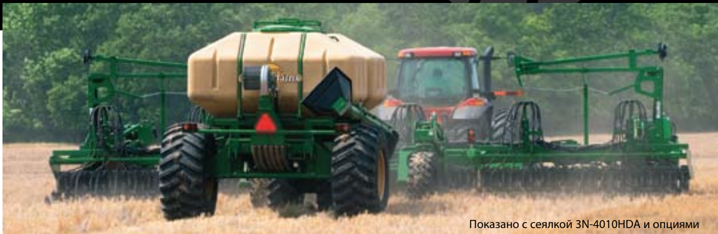
Показано с сеялкой 3N-4010HDA и опциями