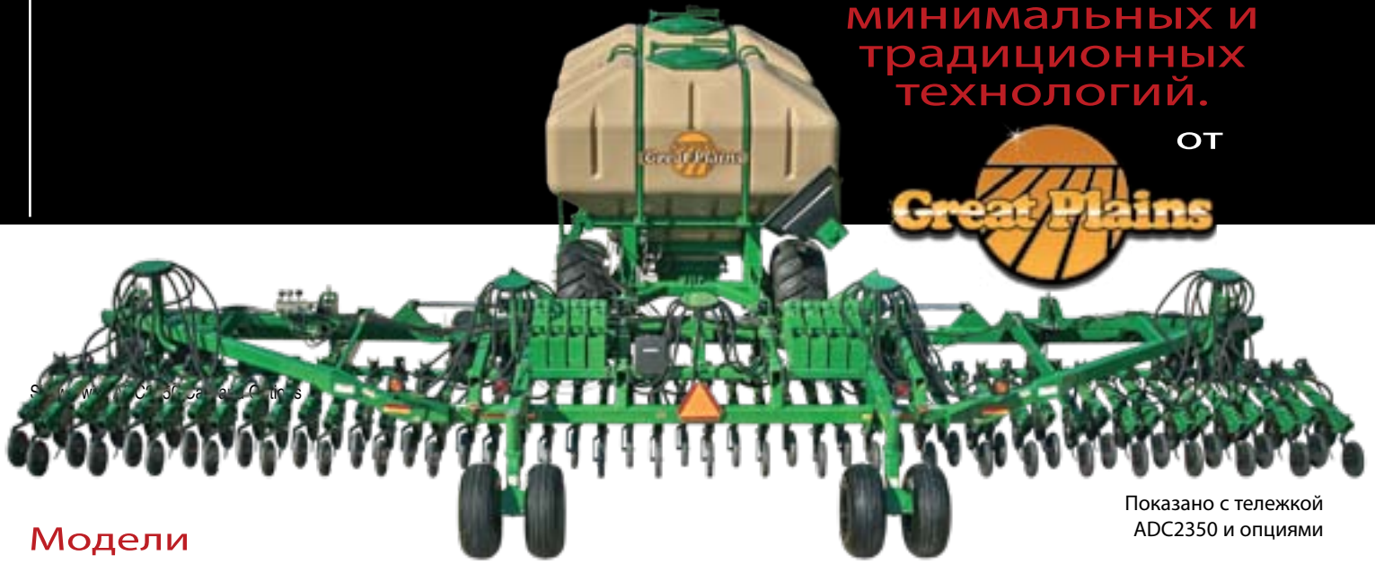
Показано с тележкой ADC2350 и опциями