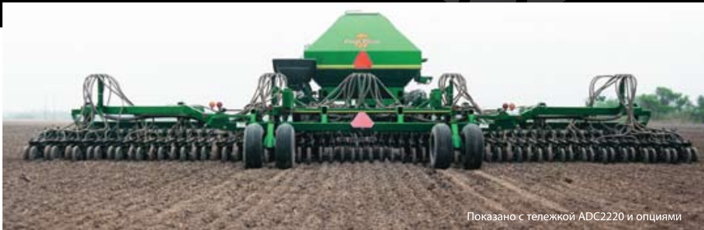
Показано с тележкой ADC2220 и опциями