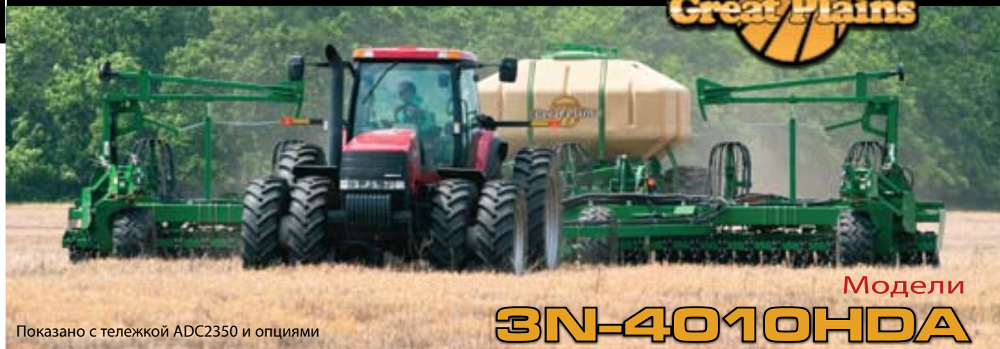
Показано с тележкой ADC2350 и опциями