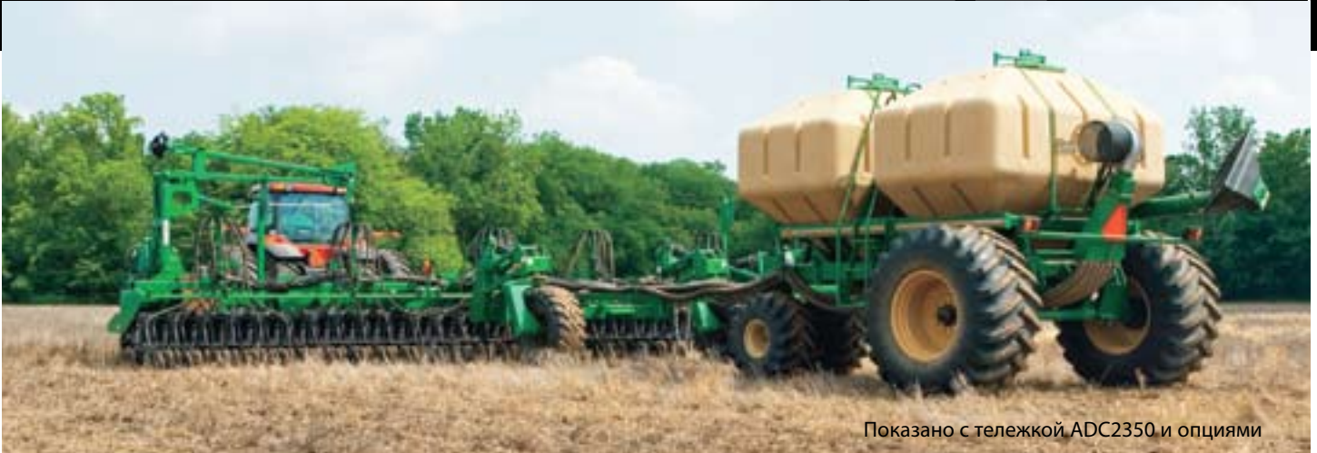
Показано с тележкой ADC2350 и опциями