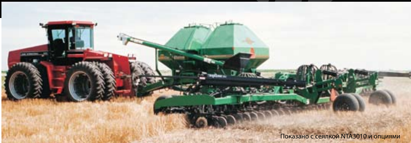
Показано с сеялкой NTA3010 и опциями