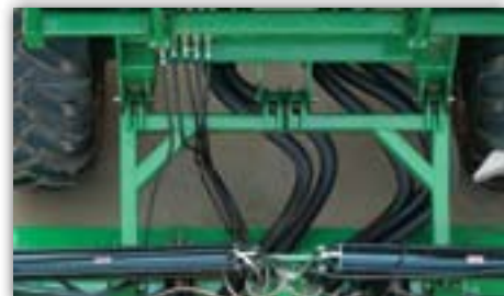
Шарнирно закрепляемая сеялка

Особенностью тележки пневматической сеялки, устанавливаемой между трактором и сеялкой, является ее шарнирно-прицепная конструкция. Такая конструкция позволяет сеялке перемещаться независимо от тележки и уменьшает длину посевного комплекса до 4,6 м. Эта особенность также дает сеялке и тележке возможность легко двигаться задним ходом в помещениях или на разворотных полосах в поле.