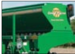
Большой семенной ящик