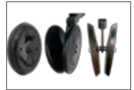
Различные виды прикатывающих колес