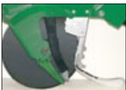
Семенные трубки, используемые на пропашных сеялках