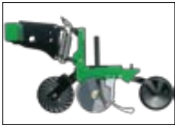
Сошники серии 10 HD