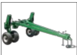
Прицепное устройство SSH