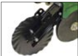
Устанавливаемые на сошник режущие диски