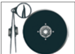
13 мм осевое смещение дисков