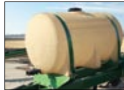
Оptionальное оборудование для внесения жидких удобрений на сцепке SSH