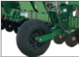
Широкая расстановка осей копирующих колес