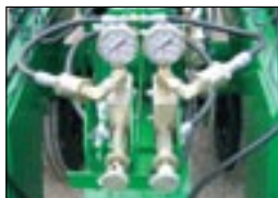
Активная гидросистема давления на сошники