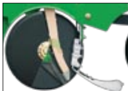
Усовершенствованная семенная трубка