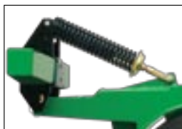
Усиленные пружины сошников