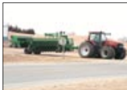
Узкая транспортная ширина