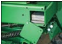
Крепление для грузов