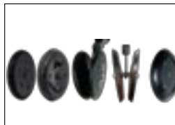
Широкий выбор прикатывающих колес