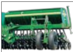
Сдвоенные опорные колеса с промышленными шинами