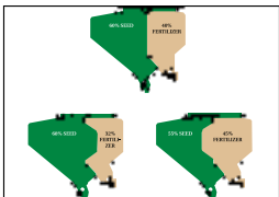
Изменяемый объем отделения для сухих удобрений