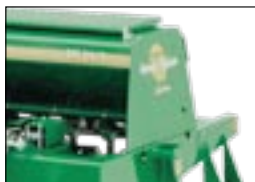
Большой семенной ящик