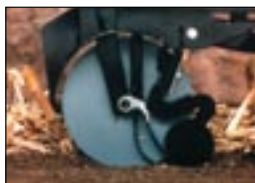
Семенная трубка и успокоитель