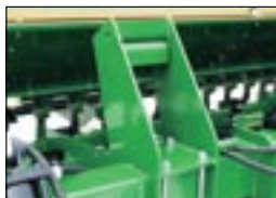
Оptionальный крепеж для дополнительных грузов