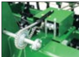
4-х скоростная коробка передач