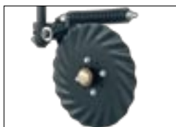
Режущие диски, устанавливаемые на раму сеялки