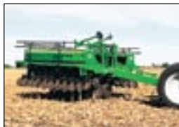
Складывание для транспортировки