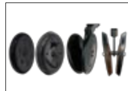
Различные виды прикатывающих колес