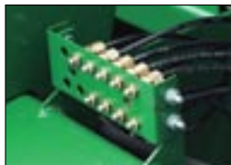
Центральная консоль смазки режущих ножей