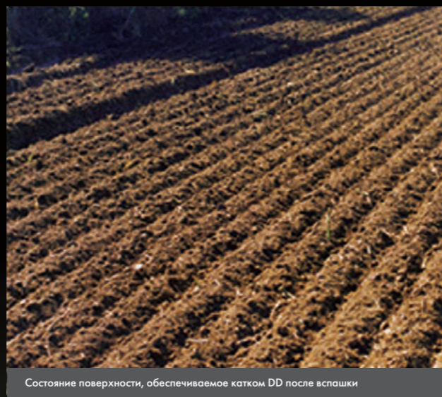
Состояние поверхности, обеспечиваемое катком DD после вспашки