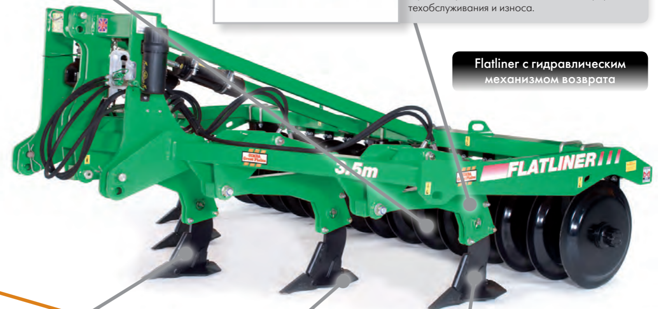
Flatliner с гидравлическим механизмом возврата